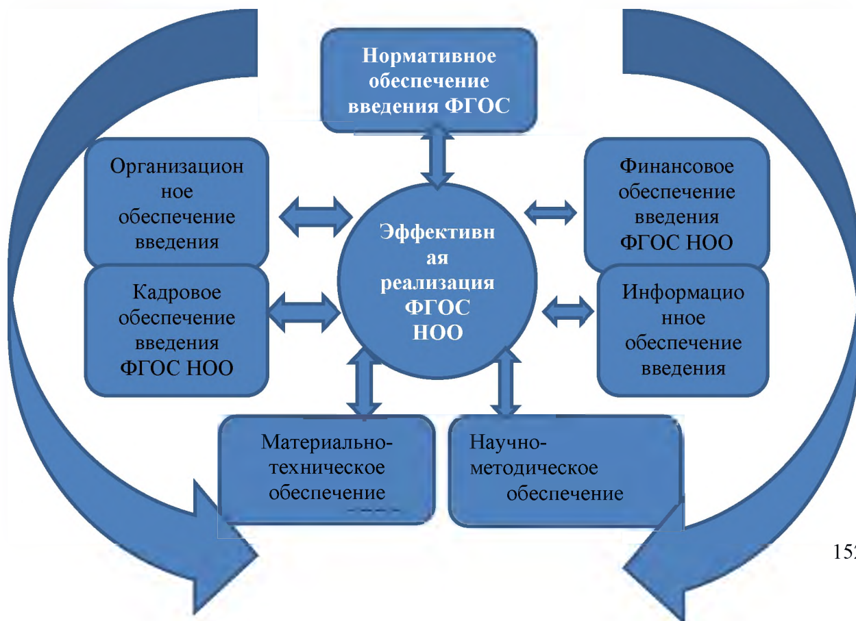
Модель сетевого графика.